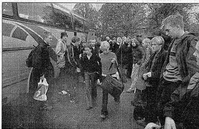
En erfarenhet rikare. Trötta efter en blåsig natt på Östersjön och fyllda av nya intryck anländer eleverna från Tunnbyskolors klass 9 A respektive 9 D till Bromölla i går. Under dagen fanns lärarna till hands på skolorna om eleverna hade några funderingar och frågor.