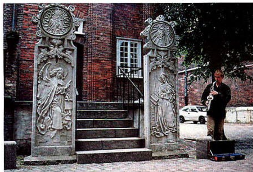
Przedproże przy ul. Mariackiej w Gdańsku / The stone stoop at Mariacka Street

się jednym z najważniejszych artykułów importowanych z wyspy. Budowniczowie i architekci, którzy w tamtym okresie rozpoczęli dzieło przebudowy miasta, mieli okazję zapoznać się z architekturą Visby, podpatrzeć pewne rozwiązania techniczne, stosowane w kościołach, budowach użyteczności publicznej, czy w systemie obronnym. Znalazły one później swoje odbicie w kształcie niektórych budowli wzniesionych w Gdańsku.